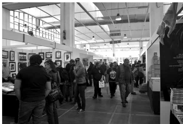
I visitatori affollano le corsie del Padiglione espositivo

sintesi di tale titolo rispetto all'obiettivo perseguito.