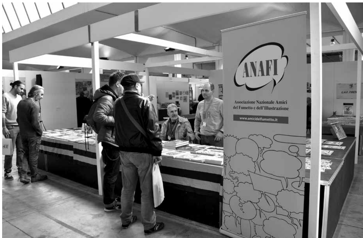
Lo stand Anafi a Collezionando 2016