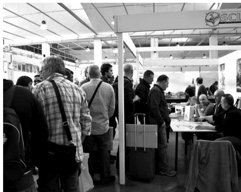
Fila in attesa allo stand del Forum SCLs

La domenica 3 aprile c'è stato inizialmente l'incontro su Jacobs e la