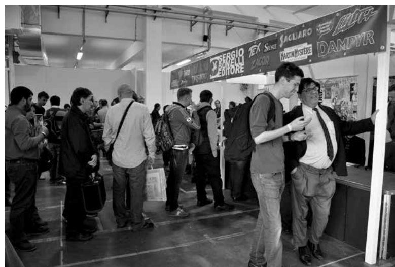
Area Firme Bonelli