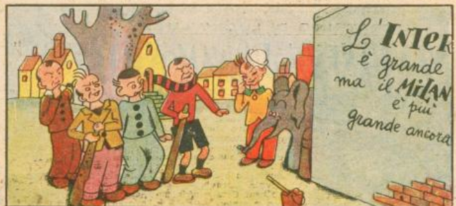
6. Arrivando sta di trotto il drappello milanista, ma si ferma lì di botto interdetto a quella vista.