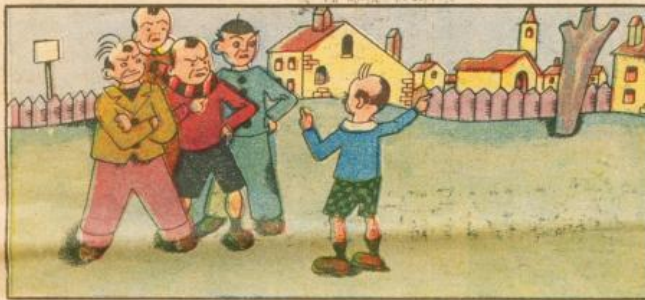
3. Il fanciul, così istruito, se ne va dai milanisti e descrive a menadito queglii scritti ch'egli ha visti.