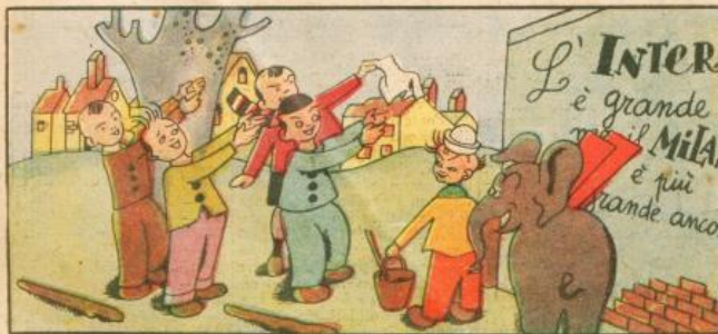
7. E' più grande il Milan? Bene! Ed applaude a mani piene Chi l'ha scritto sia lodato! il drappello ormai placato.