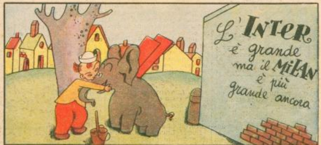
8. L'ha scampata Luccichino grazie ancora a quel tranello e contento dà un bacino al suo caro Farfarello.