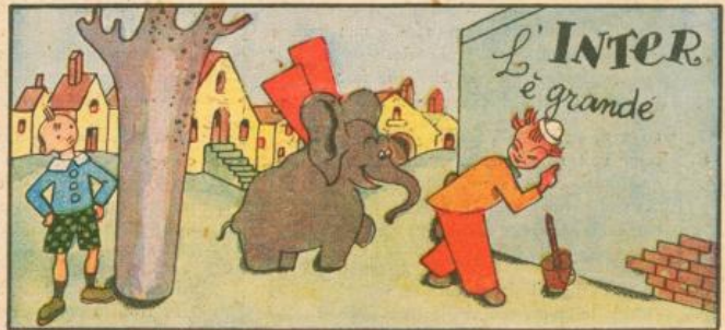
2. Il tifoso Luccichino scrive scrive in buona fede, ma da tempo un ragazzino lo spiava ed or lo vede.