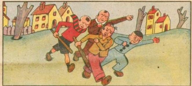
4. Ecco, ed una spedizione s'organizza detto fatto, che dovrà la punizione impartire in modo adatto.