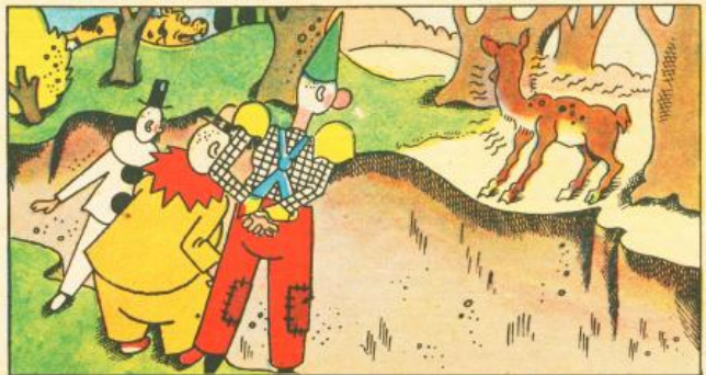
4. Per fortuna all'altra riva c'è la brava comitiva, che prestar le vuole aiuto proprio all'ultimo minuto.