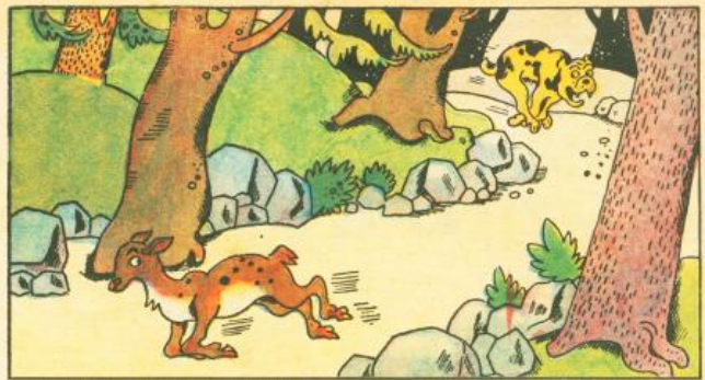
2. C'è una povera cerbiatta che tremante, esterrefatta se ne fugge a più non posso inseguita da un molosso.