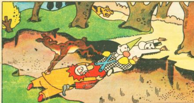
5. Lì per lì con mosse pronte le improvvisano un bel ponte: e su quello, come il lampo, la cerbiatta trova scampo.