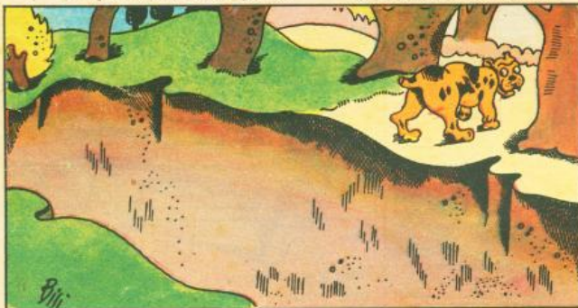
7. E, ringhiando per lo scorno, il molosso fa ritorno: oramai felice e intatta s'allontana la cerbiatta.