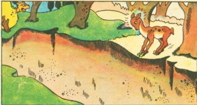
3. Ecco a un tratto una funesta fonda buca che la arresta, e di già si sente dietro del molosso il ringhio tetro.