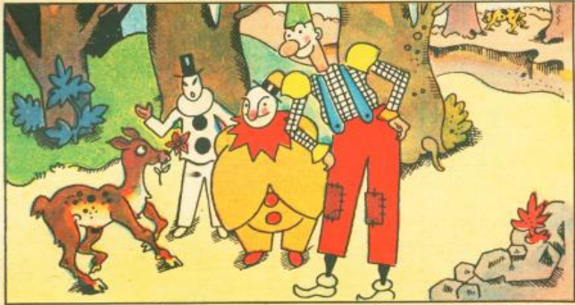
8. Essa, ancora tremebonda, vuole porgere una fronda ai tre amabili Gik-Giak del Gran Circo Patatrak.