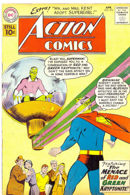
Action Comics n.275