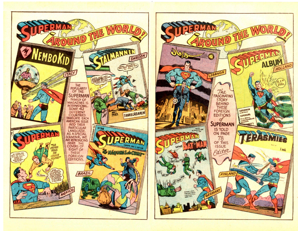
Copertine di Superman nel mondo

Il cambio di nome è probabilmente suggerito a Mondadori e ai suoi redattori dalla stessa DC Comics, che ha fin qui tollerato l'uso del nostrano Nembo Kid . Molti pensano che quest'ultima denominazione sia del tutto sconosciuta ai lettori d'oltreoceano, ma non è così. L'attento socio Anafi Maurizio Berdondini ci segnala infatti l'apparizione di una tavola con testo e illustrazioni all'interno del Giant Superman Annual n.5 dell'estate del 1962, la quale si intitola Superman Around the World! ("Superman intorno al mondo!"). Tale tavola, dove si legge tra l'altro che le avventure del supereroe sono pubblicate in 42 diverse nazioni, include le copertine di quattro edizioni straniere: brasiliana ( Superman n.59 della EBAL), messicana ( Supermán n.334 della